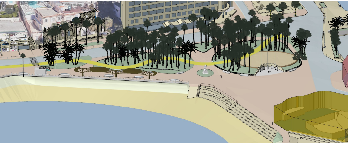
Tracé de la véloRoute bien séparé du flux piéton après les 4 km de côtoiement des promeneurs le long du bd du Midi. Vue anticipant l'esplanade des Maréchaux desservant le futur musée coiffé d'une salle polyvalente panoramique de 1000 m2.

Feu l'esplanade Leclerc ! Vive l'esplanade des Maréchaux !