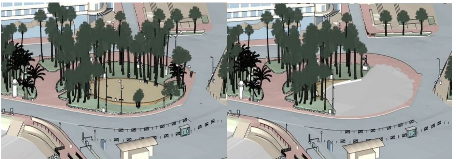
L'esplanade Leclerc hier et aujourd'hui telle qu'elle est altérée par le chantier en cours de creusement du nouveau collecteur des eaux usées. Les 3 hampes, non figurées, ont disparu, par contre, le mat de vidéo-surveillance n'a pas été enlevé pour protéger le chantier

Feu l'esplanade Leclerc ! Vive l'esplanade des Maréchaux !